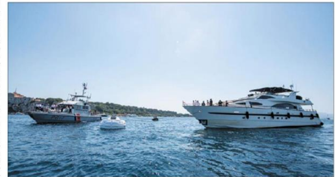
Depuis plusieurs années déjà, des zones de mouillage et d'équipements légers fleurissent le long de la côte méditerranéenne. Elles permettent aux yachts de mouiller sans qu'ils n'aient à utiliser leur ancre.

Et le bilan de la saison estivale 2023, qui court tradi-